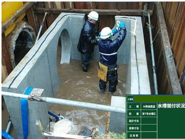
二分割水槽上下据付状況