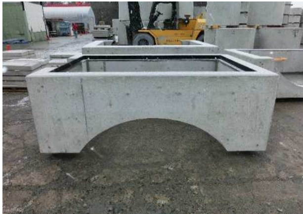
三分割集水枡(上部)