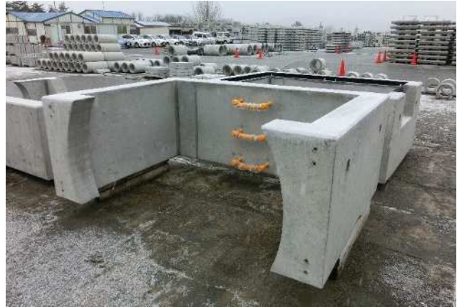
三分割集水枡(中部)