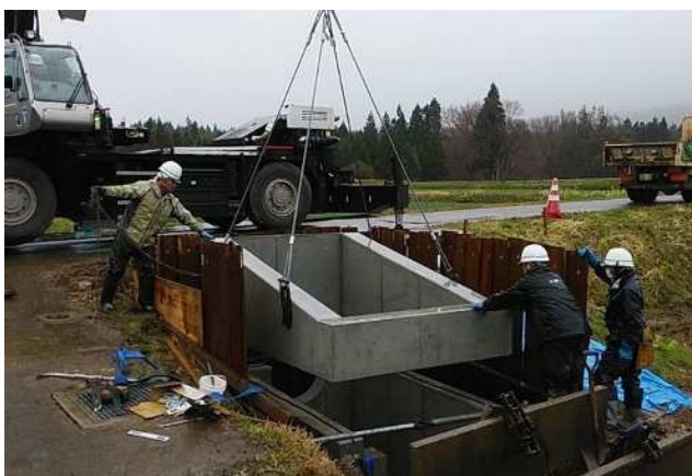
二分割水槽据付状況