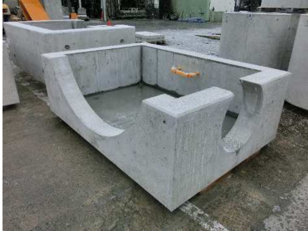
三分割集水枡(下部)