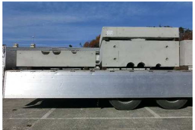
大型集水枡(三分割)車載状況/1-1