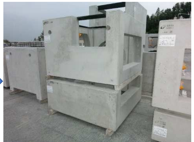
上下二分割集水枡