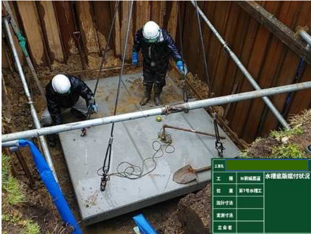
水槽 基礎板(ベースコン)