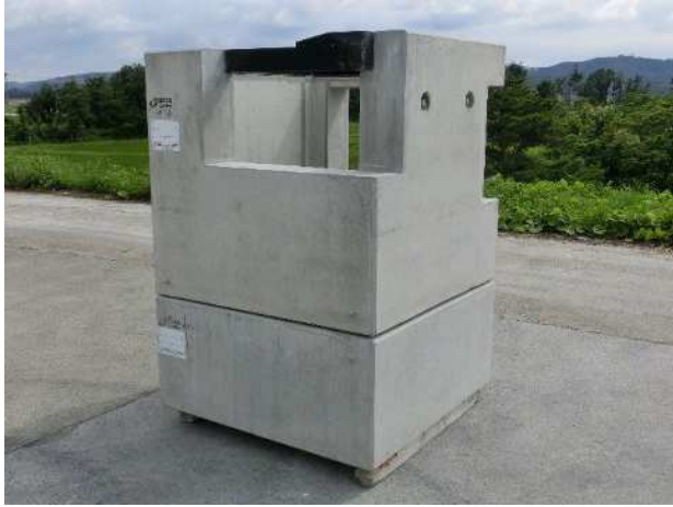
歩車道境界付落蓋側溝接続柵(上下二分割)